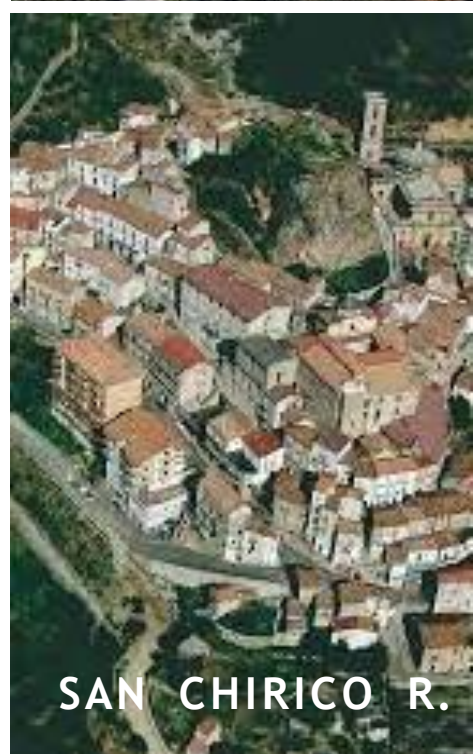
SAN CHIRICO R.